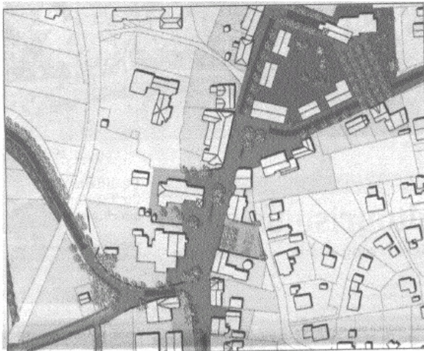
DIE BREMER STRASSE in Bohmte soll in Zukunft weniger Asphalt aufweisen und mehr Pflasterungen bekommen, Plätze und Gebäude sollen mehr ins Bewusstsein treten. Zeichnung: privat

„Bohmte wieder den Menschen zurückgeben“, das war eine hoffnungsvolle Formulierung, die an diesem Abend dem Sinne nach häufiger Verwendung fand. Den Lkw-Verkehr zwar auf der Bremer Straße zulassen, aber die „Brummis“ zu etwa Tempo 30 zwingen, das gilt als Hauptziel ausgemacht.