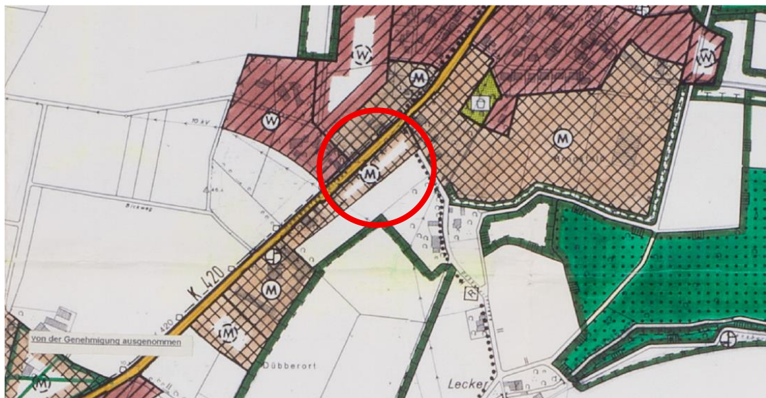
Abbildung 2: Ausschnitt aus dem Flächennutzungsplan der Gemeinde Bohmte