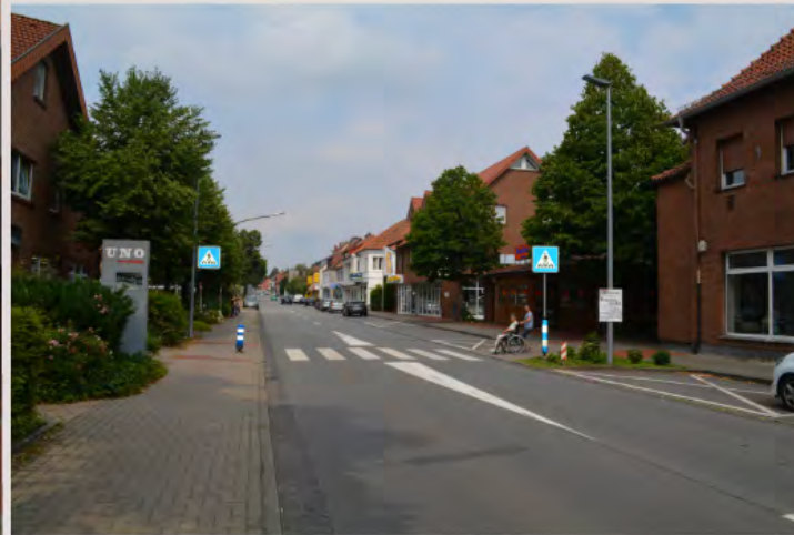
Dorferneuerung Werlte, LK Emsland Neugestaltung Ortsdurchfahrt Werlte