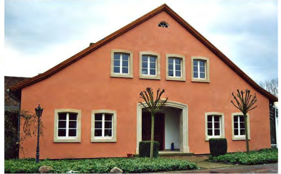
Fassadensanierung beim Wohnteil