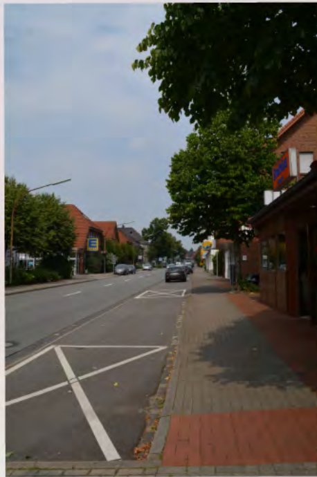
Neugestaltung der südlichen Bremer Straße