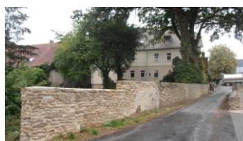
Vorhandene Bruchsteinmauer an der Straße 'Bahnwinkel'