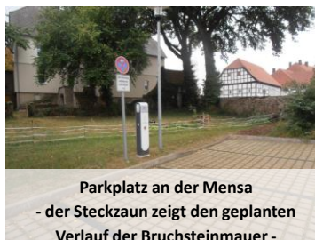
Parkplatz an der Mensa - der Steckzaun zeigt den geplanten Verlauf der Bruchsteinmauer -