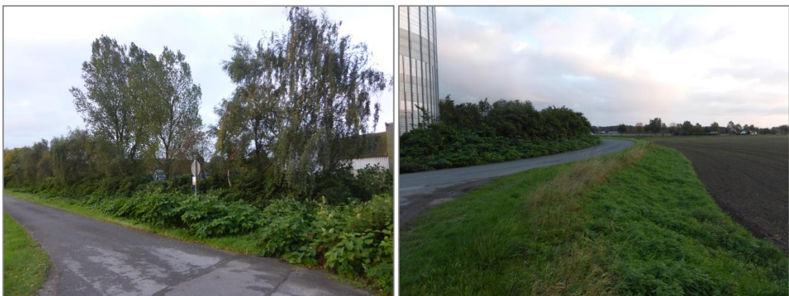
Abb. 5 Nahe des Hafengeländes stockende Birkenreihe mit Ruderalvegetation und nitrophytischer Saum im südwestlichen Randbereich des Ackers

Das Umfeld des Geltungsbereichs – das Untersuchungsgebiet – ist zum Großteil durch die landwirtschaftliche Nutzung mit einzelnen Hofstellen in zentraler, nördlicher und südlicher Lage geprägt. Es herrscht nur eine geringe landschaftliche Strukturvielfalt vor. So sind entlang des Wegenetzes kaum Gehölzbestände vorhanden. Entlang sowie südlich des Mittel-