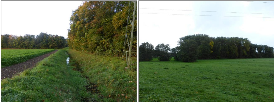
Abb. 6 Graben-, Gehölz- und Grünlandstrukturen im Untersuchungsgebiet südlich des B-Planbereiches Nr. 109

landkanals, welcher das Gebiet von West nach Ost durchzieht, ist der Gehölzbestand größer. So befindet sich ca. 150 m südlich des Kanals ein etwa 2 ha großer Waldbestand. Im Osten schließt sich die Siedlung „Stirpe“ mit Wohnbebauung an. Die Bundesstraße 51 durchzieht das Untersuchungsgebiet unmittelbar nördlich des Plangebietes von Südwest nach Nordost. Zudem verläuft eine Hochspannungsleitung von Süden Richtung Norden.