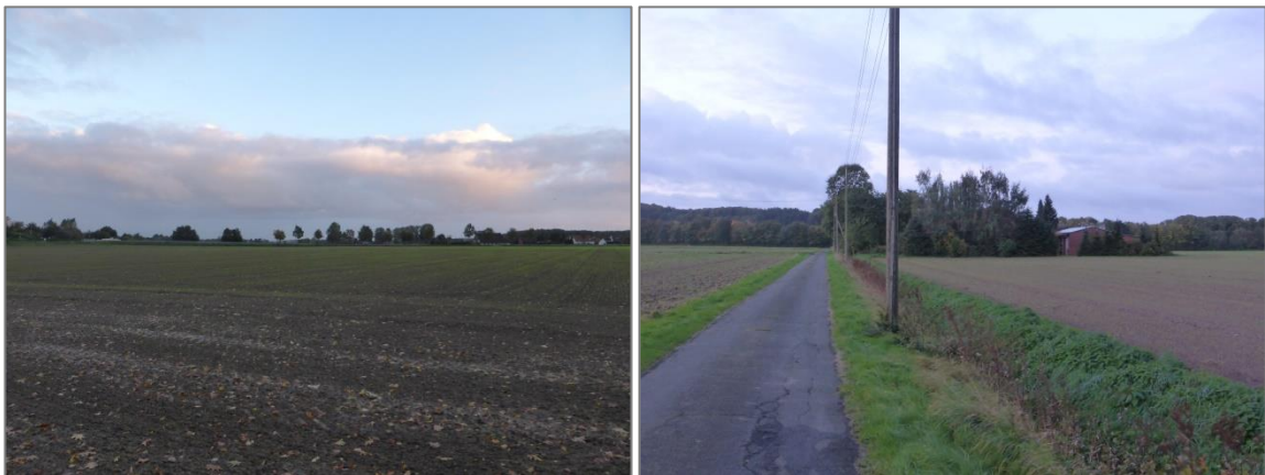
Abb. 4 Blick auf die zentrale Ackerfläche sowie die westlich der Donaustraße begleitenden Graben- und Saumstrukturen im B-Planbereich