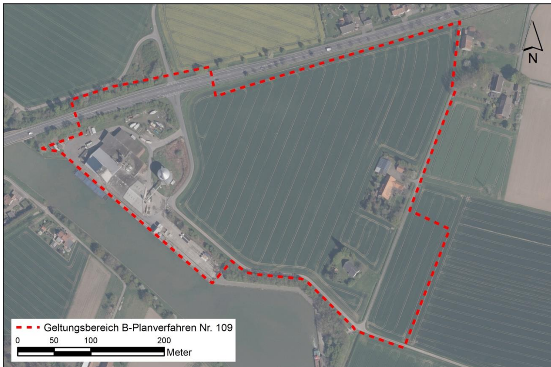
Abb. 1 Grenze des B-Planbereiches Nr. 109 (M 1:5.000)

Der vorliegende Artenschutzbeitrag (ASB) dient der Berücksichtigung der artenschutzrechtlichen Vorschriften des Bundesnaturschutzgesetzes (BNatSchG) mit denen die europarechtlichen Vorgaben in nationales Recht umgesetzt wurden.