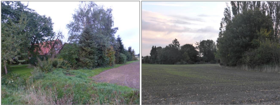
Abb. 3 Blick auf Wohnungsgebäude begleitende Gehölze im B-Planbereich Nr. 109