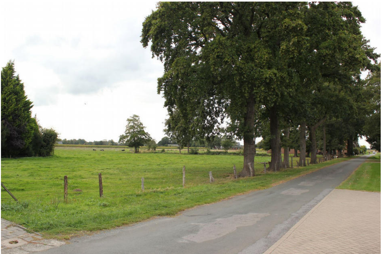
Baumreihe (Eiche) mit Grünland - An der Furth (Blickrichtung nordwest)