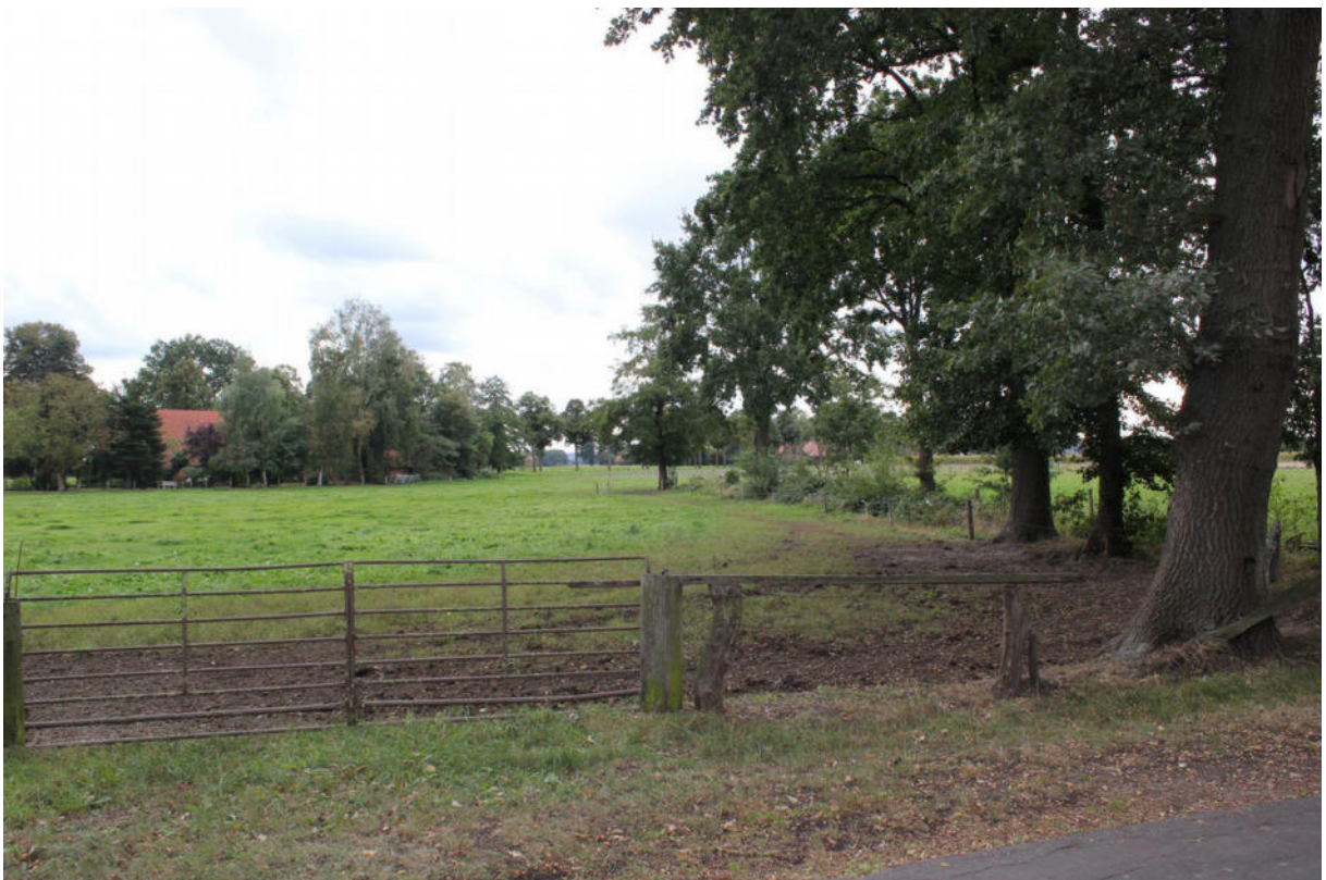
Feldhecke/Entwässerungsgraben (Blickrichtung südwest)