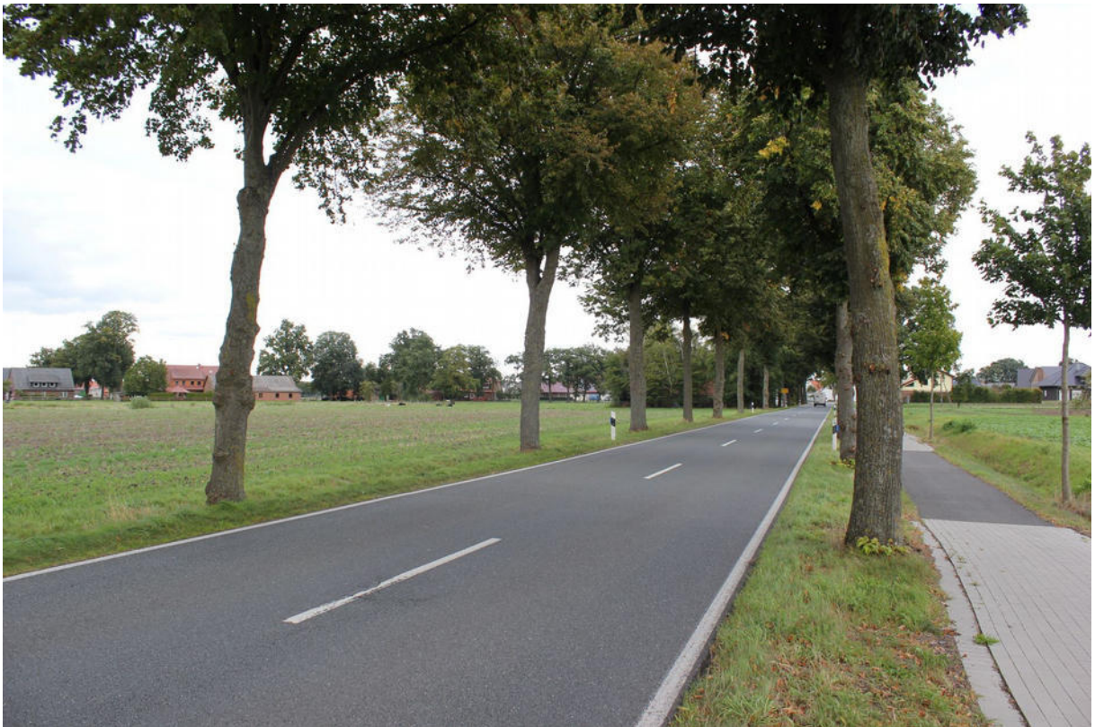
Lindenallee am Bramscher Weg (Blickrichtung nordwest)