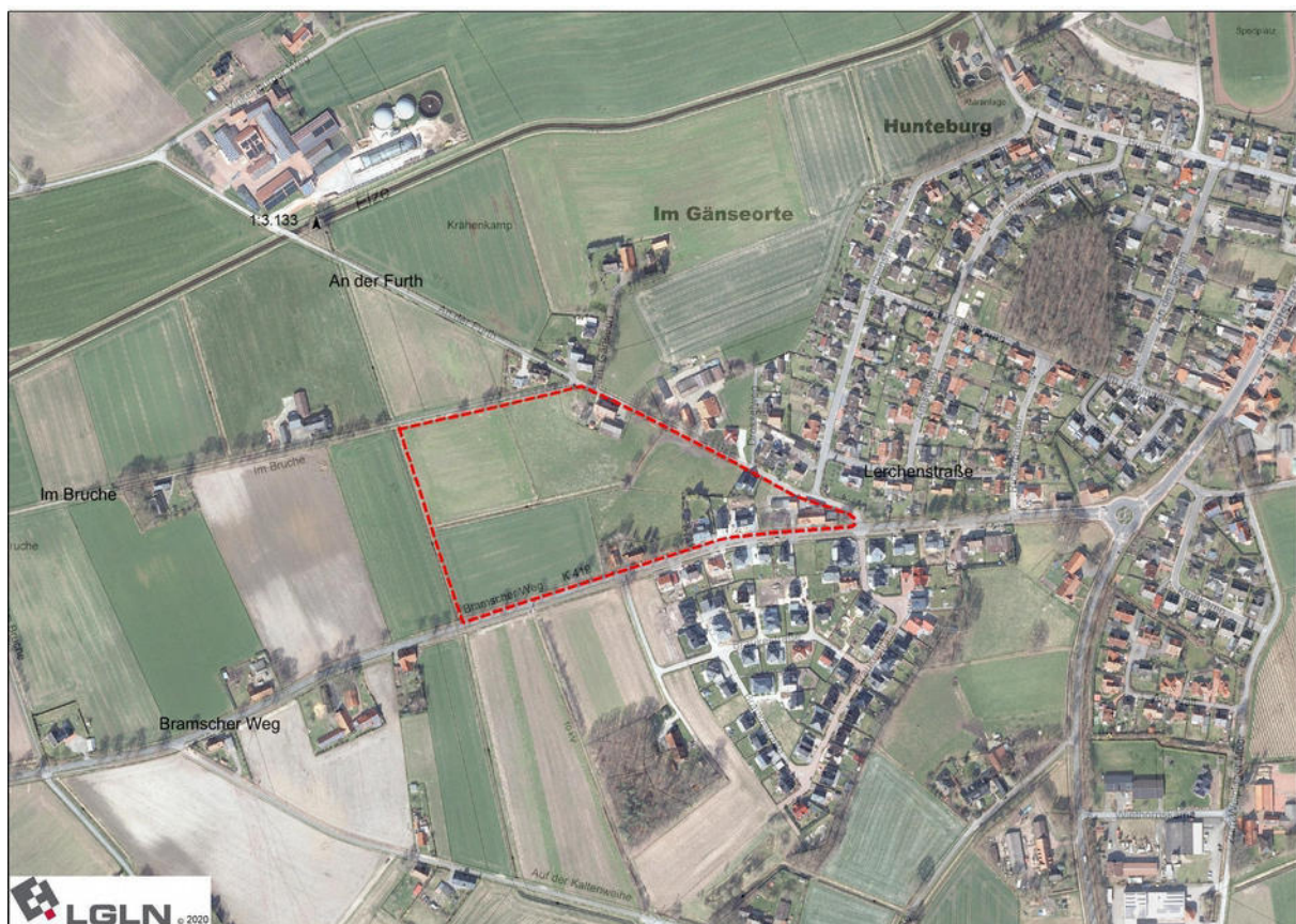
Abb. 1: Lage des Planungsraumes (ohne Maßstab)

Mais und Getreide und zum anderen, die verbleibende Fläche als Grünland mit Weidetierhaltung genutzt wurde. Zentral verläuft ein Entwässerungsgraben, der in den Gänseortgraben und im weiteren Verlauf nördlich in die Elze mündet. Die Gräben sind im Regelprofil überwiegend gehölzfrei ausgebaut. Lediglich zwischen zwei Weideflächen An der Furth befindet sich neben dem Graben eine Feldhecke. Weitere Gehölzstrukturen bzw. Baumreihen säumen den Bramscher Weg (Linden), die Straßen Im Bruche (Obstgehölze) und An der Furth (Eichen). Der Planungsraum wird im Norden von den Straßen Im Bruche und An der Furth und im Süden vom Bramscher Weg begrenzt. Den westlichen Abschluss bildet der Gänseortgraben und in östlicher Richtung der Siedlungsrand von Hunteburg. Innerhalb des Planungsraumes befinden sich einige Gebäude des Siedlungsrandes sowie jeweils am Bramscher Weg und An der Furth zwei weitere Wohngebäude incl. Nebengebäude und Garten. Das Umfeld ist geprägt durch das sich anschließende Siedlungsgebiet bzw. durch landwirtschaftliche Nutzflächen bei einem geringen Wald- bzw. Gehölzbestand.