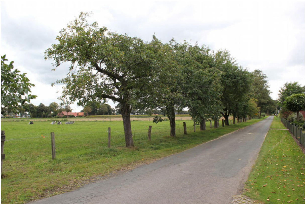
Baumreihe (Obstgehölze) - Im Bruche (Blickrichtung südwest)