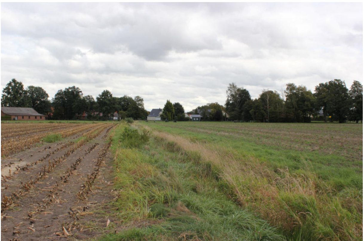
Ackerfläche mit Entwässerungsgraben (Blickrichtung ost)