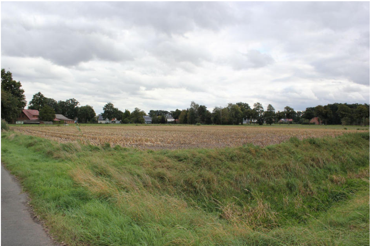
Ackerfläche, im Vordergrund der Gänseortgraben - Im Bruche (Blickrichtung südost)