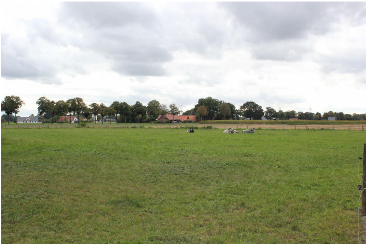
Grünland mit Weidetierhaltung (Blickrichtung süd)