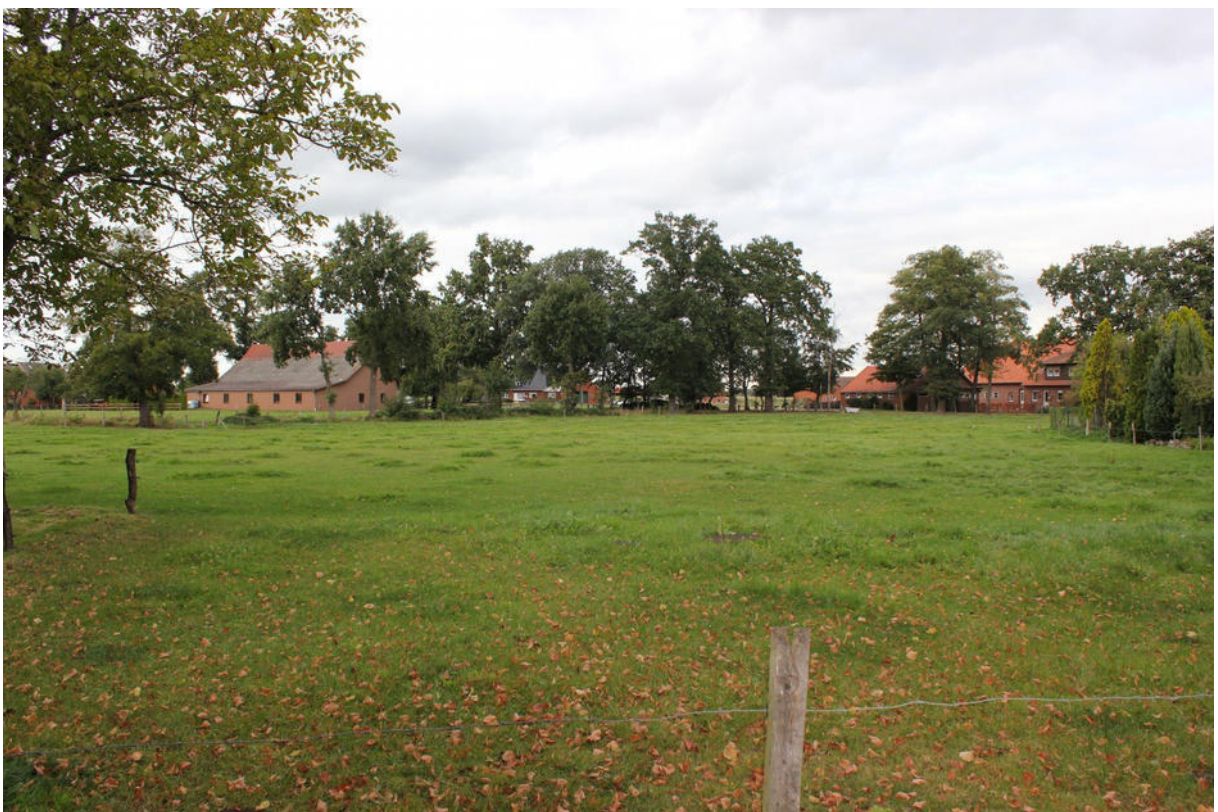
Grünland am Bramscher Weg (Blickrichtung nordwest)