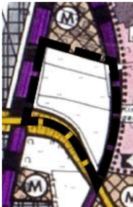
Abb.: Wirksamer FNP

Das Plangebiet ist in der wirksamen Flächennutzungsplandarstellung der Gemeinde Bohmte weitestgehend als Fläche für die Landwirtschaft sowie anteilig am südlichen Randbereich als Verkehrsfläche ausgewiesen. Da im Bebauungsplan Flächen für Sport- und Spielanlagen festgesetzt werden sollen, ist der Flächennutzungsplan im Parallelverfahren entsprechend zu ändern.