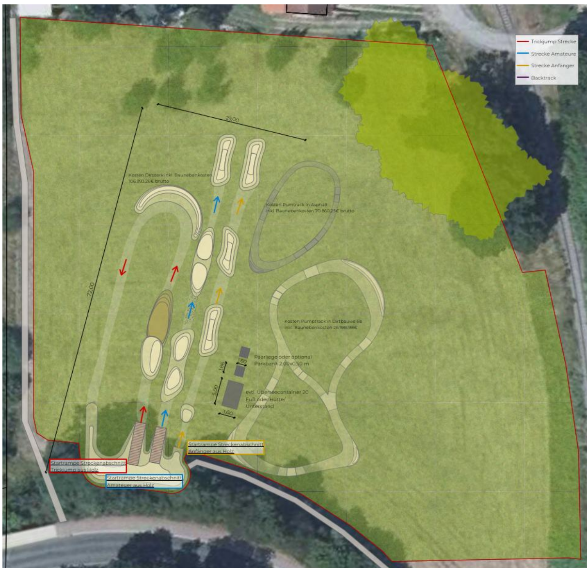
Erschließungskonzept © Die Grünplaner Landschaftsarchitekten

Für den Dirtpark sind drei Strecken mit verschiedenen Schwierigkeitsgraden (Trickjump, Amateur, Anfänger) vorgesehen. Gestartet wird die Fahrt jeweils von Startrampen aus Holz. Die Fahrtstrecke sowie die Sprünge werden aus natürlichen Materialien (Boden, Sand) hergerichtet, sodass durch die Fahrtstrecke keine Versiegelung erforderlich wird. Auf den Flächen außerhalb der Fahrtstrecken soll Rasen angesät werden.